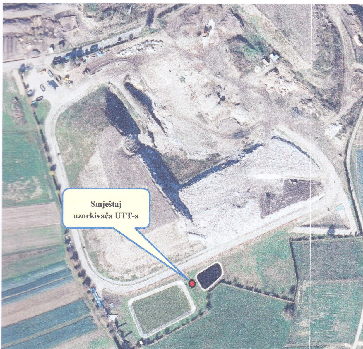
Slika 1. Prikaz uzorkivača za UTT na lokaciji uzorkovanja MU-1-Č